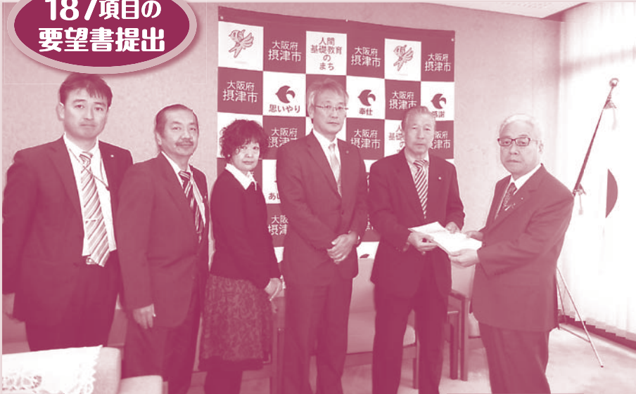
要望書を市長に提出

昨年11月20日、森山市長へ要望書を提出し、12月に小野副市長と、1月に森山市長と懇談を行ってきました。社会保障のためといって消費税8%へ増税しておきながら、介護報酬の2.27%減額、年金の実質引下げをはじめ社会保障を切り捨てています。日本共産党は、市民のくらしを守り、しっかり支えていくべきだと主張。(1)国保料や介護保険料など公共料金の据え置き、北摂で一番高い上下水道料金の引下げを行うこと。(2)市民のくらしに係る制度の廃止・縮小は止めること。(3)公的責任の後退につながる民間委託・民営化は止めること。など求めました。