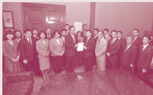
衆院へ提出する党議員団

制度開始から20年間で総額約6,311億円となります。なんの苦勞もなしに巨額の税金が転がり込む制度が、政党・政治家の金銭感覚を麻痺させ、政治腐敗を加速させています。政党と政治を堕落させる元凶になっています。